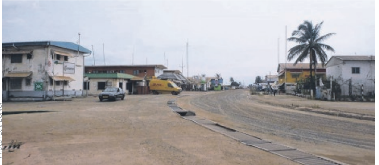
Une vue d'une artère de la ville de Port-Gentil.